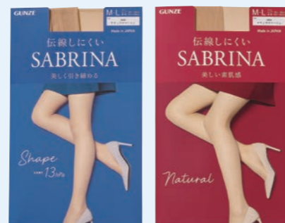
ナチュラルベージュ

人気のSABRINAストッキングから美し い透明感のナチュラルタイプと美しく引き 締めるシェイプタイプを2足1セットにしま した。就職活動、入学式、卒業式など、 フォーマルシーンにもおすすめです。