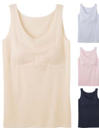
KIREILABO 完全無縫製 さらさら強撚綿ラン型インナー(カップ付) [品番]KL3758 [希望小売価格]¥1,600+税