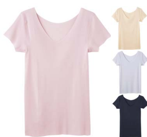
KIREILABO 完全無縫製 さらさら強撚綿 2分袖インナー [品番]KL3752 [希望小売価格]¥1,800+税