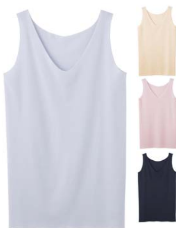
KIREILABO 完全無縫製 さらさら強撚綿ラン型インナー [品番]KL3754 [希望小売価格]¥1,400+税

「完全無縫製 さらに強撚綿インナー」は、夏に最適な強撚綿を使用しています。綿混率を上げるほど、縫い目を無くすための接着加工が難しくなりますが、当社独自の接着技術によって、強撚綿 50%を実現しました。強撚綿特有のさらさらした着ごちが特徴です。襟ぐりは女性らしいなだらかなVネック仕様で、デコルテにすっきりフィット。縫い目がなく肌にやさしいだけでなく、袖口や裾も切りっぱなしなので、薄着でもアウターに響かず、ファッションの邪魔をしません。