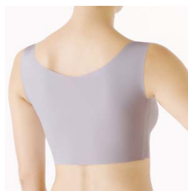
完全無縫製 ひびきにくい接触冷感ハーフトップ ¥1,600+税