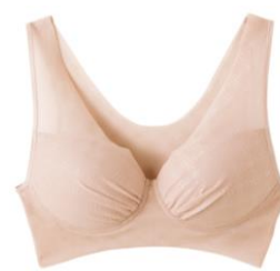
(VR)ロイヤルベージュ