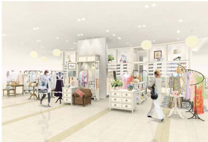
阪急うめだ本店 7階ホームリラクシング売場 (中央柱巻きとその前面部分にて展開)