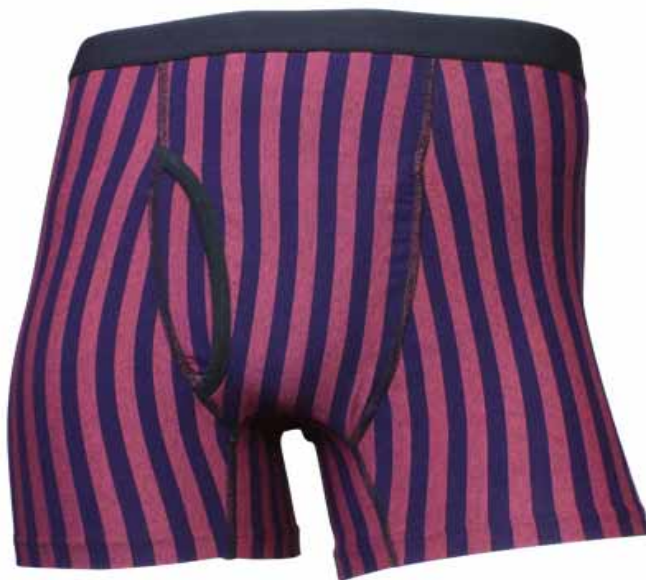
GRANDFIT ボクサーブリーフ(前開き)

「GRANDFIT(グランフィット)」は、「カッコよくありたい」シニア男性に“こちよさ”をデザインした新しいシニアインナーです。50代からの男性の体型変化に加え、デリケートになった肌、気になる汗のニオイにも対応した機能を持ち、さらに、ボトムスには尿じみに対応する撥水素材も使用しています。