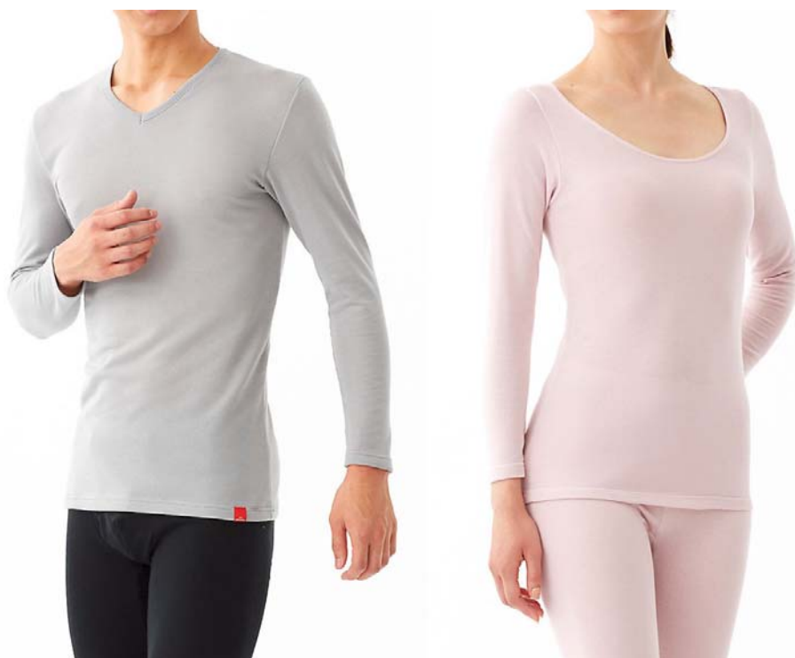
写真左(メンズ): Vネック9分袖シャツ、タイツ

冬の機能性インナーと言えば、吸湿発熱性能のある化学繊維を使った薄くて軽いものが主流ですが、2013年秋冬シーズン「HOTMAGIC」からは、天然素材でパイル調&肌側起毛加工を施した新商品を新発売します。中肉の素材を起毛することで、見ても触っても暖かです。「肌着はやっぱり天然素材」とこだわる方にお勧めしたい、綿65%混の保温インナーです。