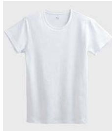
品名 : クルーネックTシャツ YV0213 サイズ : M、L、LL 本体価格 : ¥1,000+税 カラー : ホワイト、ブラック、 チャコールグレー ボルドー