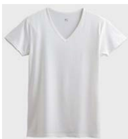
品名 : VネックTシャツ YV8015 サイズ : M、L、LL 本体価格 : ¥1,300+税 カラー : ホワイト、ブラック、 チャコールグレー