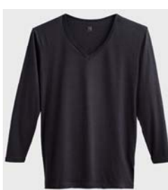
品名 : Vネック9分袖シャツ YV8009 サイズ : M、L、LL 本体価格 : ¥1,500+税 カラー : ホワイト、ブラック、 チャコールグレー