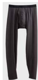
品名 : タイツ(前あき) YV8001 サイズ : M、L、LL 本体価格 : ¥1,500+税 カラー : ブラック、 チャコールグレー