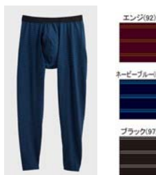
品名 : タイツ(前あき) YV8501 サイズ : M、L、LL 本体価格 : ¥1,300+税 カラー : ネービーブルー、 エンジ、ブラック