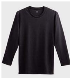
品名 : 9分袖シャツ YV0208 サイズ : M、L、LL 本体価格 : ¥1,200+税 カラー : ホワイト、ブラック、 チャコールグレー ボルドー