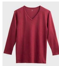
品名 : Vネック9分袖シャツ YV0209 サイズ : M、L、LL 本体価格 : ¥1,200+税 カラー : ホワイト、ブラック、 チャコールグレー ボルドー