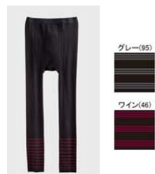
品名 : タイツ(前あき) YV8504 サイズ : M、L、LL 本体価格 : ¥1,300+税 カラー : グレー、ワイン