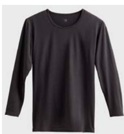
品名 : 9分袖シャツ YV8008 サイズ : M、L、LL 本体価格 : ¥1,500+税 カラー : ホワイト、ブラック、 チャコールグレー