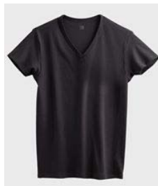
品名 : VネックTシャツ YV0215 サイズ : M、L、LL 本体価格 : ¥1,000+税 カラー : ホワイト、ブラック、 チャコールグレー ボルドー