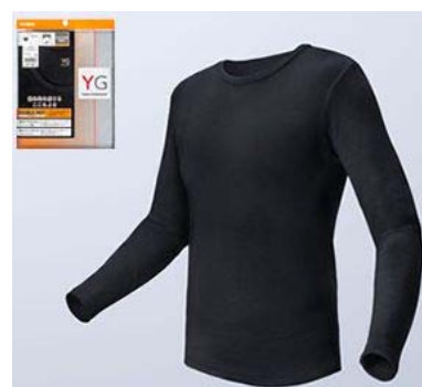
<ポスター着用用品番> YG ダブルホット 9分袖シャツ