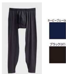
品名 : タイツ(前あき) YV8502 サイズ : M、L、LL 本体価格 : ¥1,300+税 カラー : ネービーブルー、 ブラック