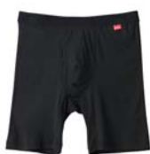
商品名:ロングボクサー(前あき) 品番:MH1685 カラー:3色(オフホワイト、 チャコールグレー、ブラック) 希望小売価格:¥1,500+税