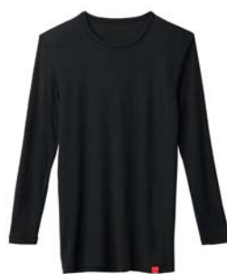
商品名:9分袖シャツ 品番:MH1608 カラー:3色(オフホワイト、 チャコールグレー、ブラック) 希望小売価格:¥1,800+税