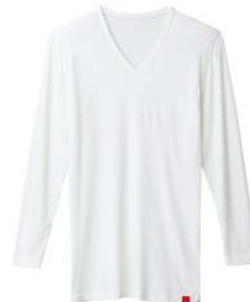
商品名:Vネック9分袖シャツ 品番:MH1609 カラー:3色(オフホワイト、 チャコールグレー、ブラック) 希望小売価格:¥1,800+税