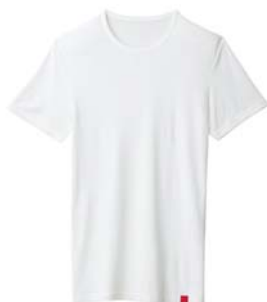
商品名:クルーネックTシャツ 品番:MH1614 カラー:3色(オフホワイト、 チャコールグレー、ブラック) 希望小売価格:¥1,500+税