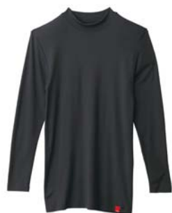
商品名:ハイネック9分袖シャツ 品番:MH1610 カラー:3色(オフホワイト、 チャコールグレー、ブラック) 希望小売価格:¥1,800+税