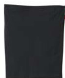
商品名:ウエストウォーマー 品番:MH1670 カラー:3色(チャコールグレー、 ブラック) 希望小売価格:¥1,000+税