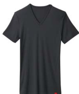
商品名:VネックTシャツ 品番:MH1615 カラー:3色(オフホワイト、 チャコールグレー、ブラック) 希望小売価格:¥1,500+税