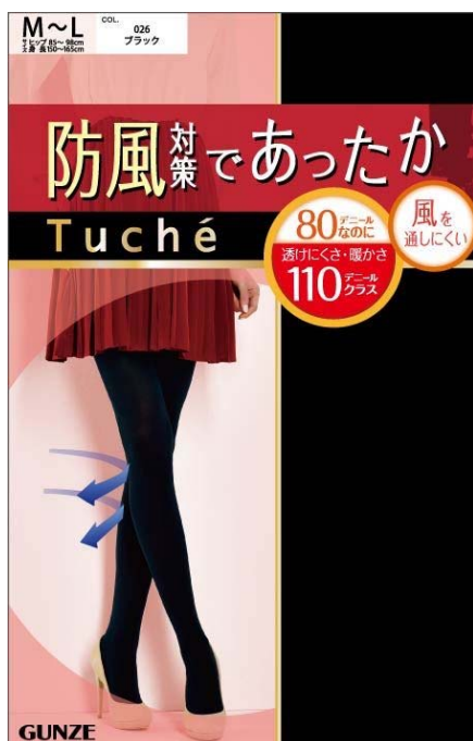
【Tuché 防風対策であったか】

今年の秋冬のファッショントレンドとして、ミニボトムの人気は依然として根強く、また、ショートブーツの着用比率は、年々上昇しています。そこで、ミニボトム+ショートブーツで脚を見せるスタイルに合わせて、通常のタイツより緻密に編んで保温性を高めた「防風対策であったか」と、タイツの代表的なお悩み“毛玉”が出来にくい「丈夫さアップ」を新たにラインナップに加え、新発売します。