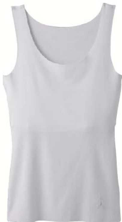
「pied clair」 タンクトップ / QPK0570-80 / ¥1,280+税

発売以来23年が経ち、少子化傾向の中、世の中のトレンドや学校生活環境は大きく変化しました。直近の親子調査において、学校生活環境でのインナーの役割や着用シーンは多岐に渡り、従来の成長に合わせた商品ラインナップから、よりキモチの変化に沿った商品を求められる傾向があることが分かりました。特に「制服や、体操服からインナー・ブラジャーが透けるのが気になる」という声に応え、ブラウスや体操服から透けにくい「シークレットインナー」シリーズを発売します。