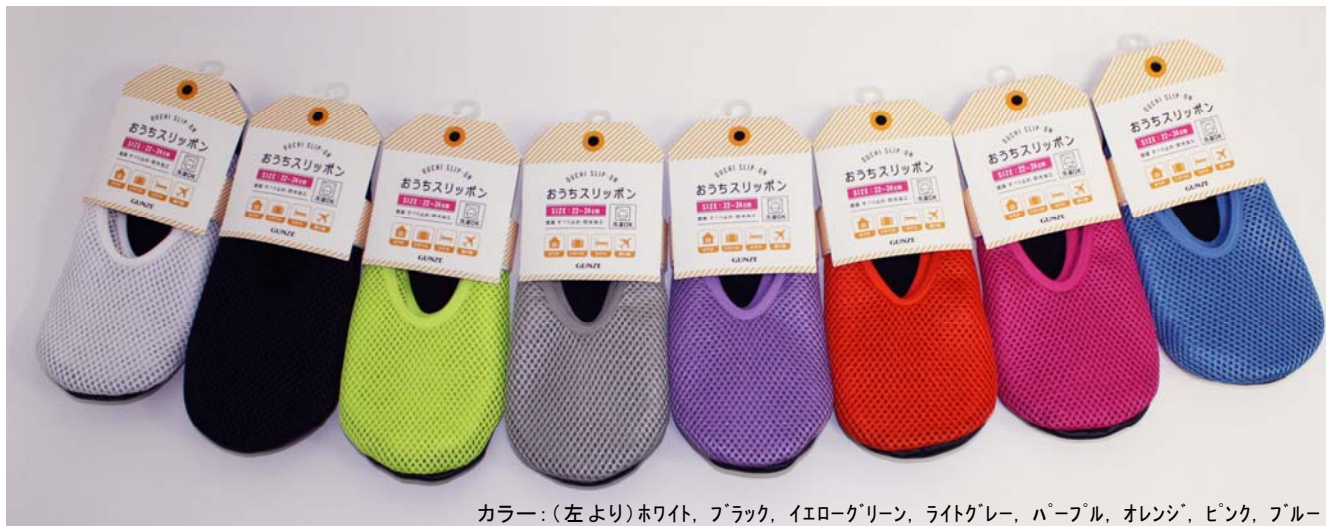
カラー:(左より)ホワイト、ブラック、イエローグリーン、ライトグレー、パープル、オレンジ、ピンク、ブルー

グンゼ株式会社(本社:大阪市)は、室内で着用できるスリッポン「おうちスリッポン」を新発売します。