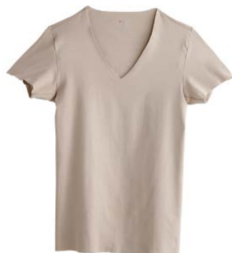
商品名：Vネック T シャツ 品番：YV0415 希望小売価格：¥1,500+税