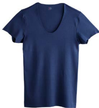
商品名：Uネック T シャツ 品番：YV0416 希望小売価格：¥1,500+税

※いずれも 素材：綿 90%・ポリウレタン 10% カラー：3色 〔ホワイト、クリアベージュ ヌードベージュ・ネービーブルー〕 サイズ：M・L・LL