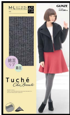
品名 : 綿混リブ 品番 : TH554H