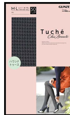
品名 : ハウンドトゥース 品番 : TH557H