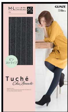
品名 : ピンストライプ 品番 : TH558H