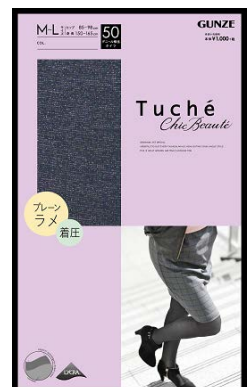
品名 : プレーンラメ 品番 : TH555H