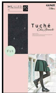
品名 : ドット 品番 : TH559H