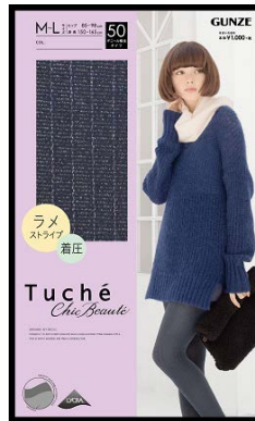
品名 : ラメストライプ 品番 : TH556H