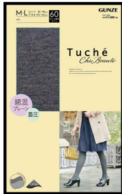
品名 : 綿混プレーン 品番 : TH553H