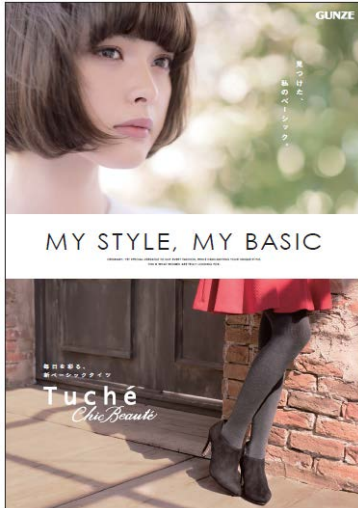
〈ポスタービジュアル〉