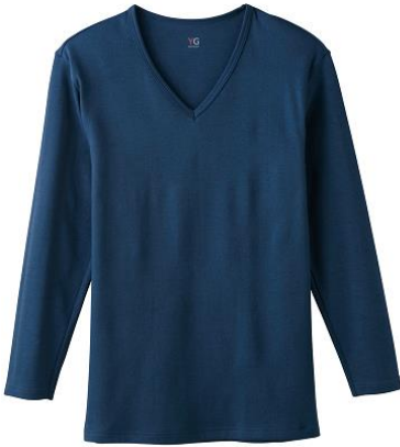
Vネック9分袖シャツ YV0209P ¥1,300+税