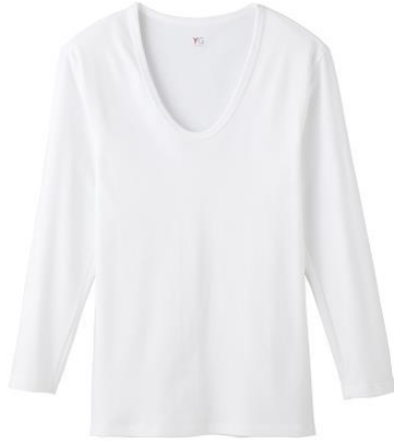
ラウンドネック9分袖シャツ YV0210P ¥1,300+税