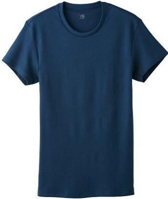
クルーネックTシャツ YV0213P ¥1,000+税