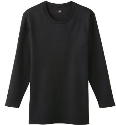
9分袖シャツ YV0208P ¥1,300+税