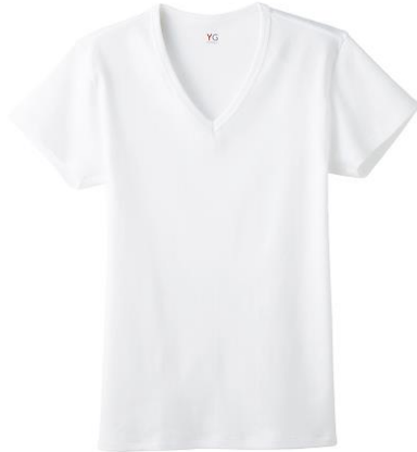
VネックTシャツ YV0215P ¥1,000+税