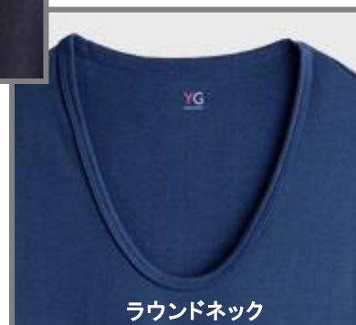
ラウンドネック9分袖シャツ YV0210P ¥1,300+税