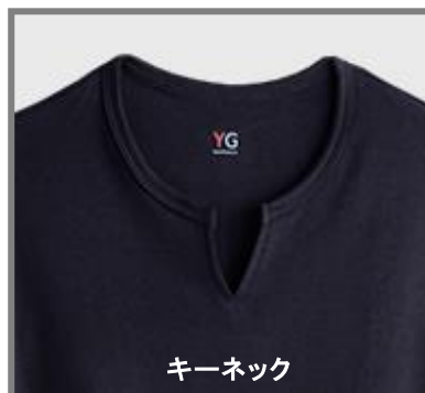
キーネック9分袖シャツ YV0211P ¥1,300+税