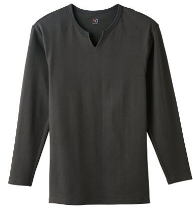
キーネック9分袖シャツ YV0211P ¥1,300+税

※ いずれも M/L/LL 4色展開(ホワイト・ダークブルー・チャコールグレー・ブラック)