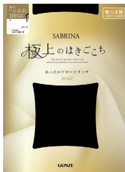
プレーティングタイツ 110d 希望小売価格 ¥1,500 円+税

「SABRINA」は、デビュー20周年を迎えた2014年に、“強く、やさしく、美しく”をコンセプトにやさしい肌ざわりや耐久性、脚を美しく見せるこだわり仕様の上質なストッキングを発売しました。