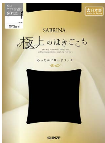
プレーティングタイツ 80d 希望小売価格¥1,200 円+税