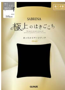
プレーティングタイツ80d 品番 SZW80 希望小売価格 ¥1,200+税