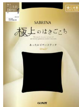
プレーティングタイツ110d 品番 SZW110 希望小売価格 ¥1,500+税