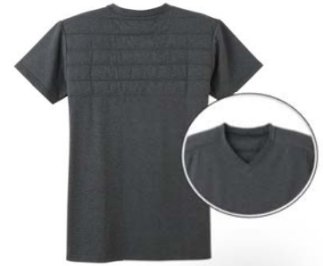
品名：半袖V首 Tシャツ 品番：WJ1015 希望小売価格：¥2,800+税 サイズ：M/L/LL カラー：ブルーモク/ブラックモク/ レッドモク/サンドイエロー