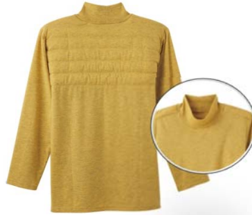
品名：長袖ハイネック Tシャツ 品番：WJ1010 希望小売価格：¥3,000+税 サイズ：M/L/LL カラー：ブルーモク/ブラックモク/ レッドモク/サンドイエロー