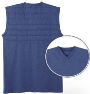
品名：ベスト 品番：WJ1018 希望小売価格：¥2,500+税 サイズ：M/L/LL カラー：ブルーモク/ブラックモク/ レッドモク/サンドイエロー