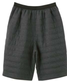
品名：ハーフパンツ 品番：WJ1007H 希望小売価格：¥4,000+税 サイズ：M/L カラー：ブルーモク/ブラックモク/ レッドモク