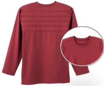
品名：長袖丸首 Tシャツ 品番：WJ1008 希望小売価格：¥3,000+税 サイズ：M/L/LL カラー：ブルーモク/ブラックモク/ レッドモク/サンドイエロー

「WONDER WARM®」は軽くて防寒性があり、アウターにひびきにくいインナーウエアです。トレンド感のあるシルエットを採用し、日常使いからレジャー・アウトドアなど様々なシーンでの着用在が広がるデザインにしました。冬らしい温かみのあるカラーバリエーションで展開します。