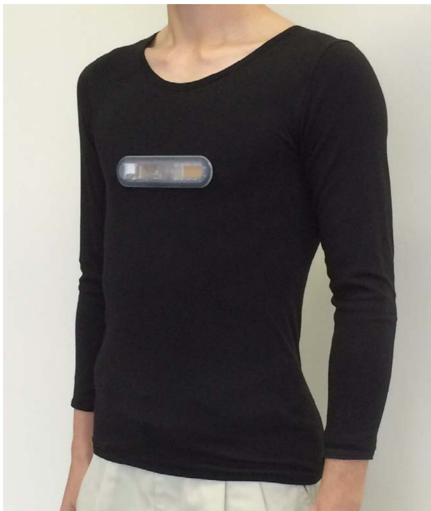
衣料型ウェアラブルシステム

この衣料型ウェアラブルシステムを、「第2回ウェアラブル EXPO(ウェアラブル端末の活用と技術の総合展)」(会期:2016年1月13日~15日、会場:東京ビッグサイト)に出展します。