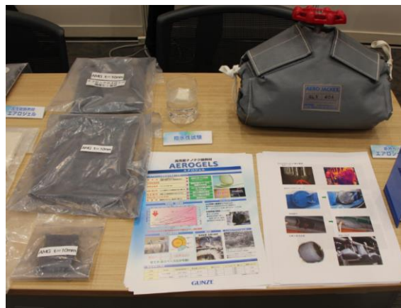
当社が取り扱うエアロジェルなどの製品