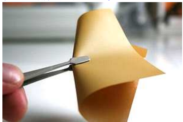
図2 絶縁性熱拡散ポリイミドシート

この絶縁性の熱伝導性ポリイミドについてはこれまでに熱伝導率が1W程度で絶縁破壊電圧(気中測定)は50~80kV/mm前後をサンプル化できており、現在はより高い熱伝導性の実現とさらなる機能付与として熱伝導の方向性制御に取り組んでいる。